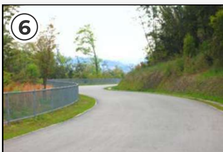
⑥ コース終盤はカーブが多め。