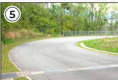
⑤ ここの下り急カーブに注意!