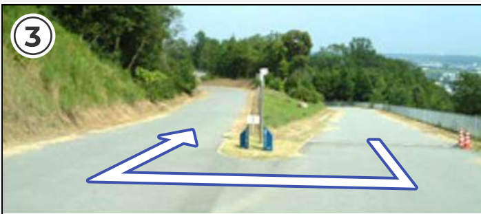
③ 上りきったら180°の急カーブ。