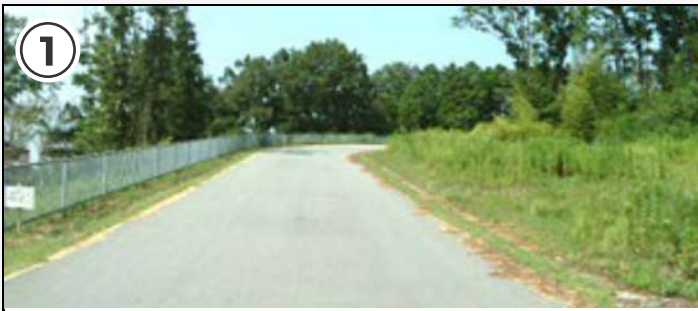
① スタート直後から上り坂。